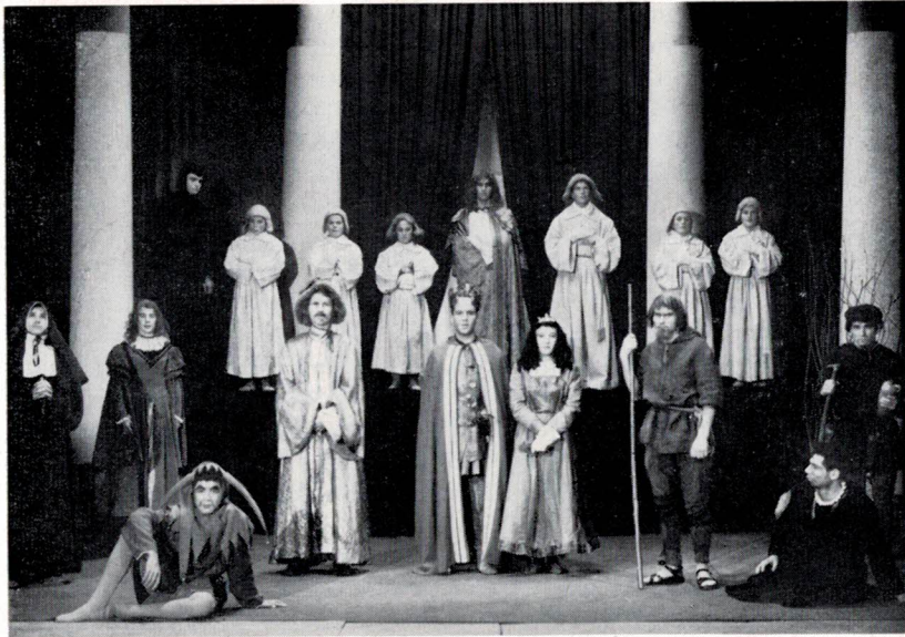
Das Salzburger Große Welttheater von Hugo von Hofmannsthal. Bei der Aufführung des «Jedermann» von Hofmannsthal im Kollegium 1930 hatte der jetzige Bundespräsident die Rolle des Herrgotts gespielt.

ihm vor Jahren das geistige Rüstzeug auf den Lebensweg mitgegeben hatte. Er stellte den Bundespräsidenten auch als ein Vorbild und Beispiel hin, welches zeigt, wie man es mit Fleiß, Ausdauer und bescheidenem Dienen von unten her zu etwas bringen kann. Seinen Mitschülern gab der Senior den guten Rat, immer zu bedenken, daß auch Herr von Moos einst die gleichen harten Schulbänke drücken und sich mit den oft lästigen Regeln, Formeln und Vokabeln herumschlagen mußte. Das «Salzburger Große Welttheater» von Hugo von Hofmannsthal bildete mit seiner tiefen Bedeutung einen würdigen Abschluß der gediegenen Feier. Mit ein paar bedeutsamen Worten dankte Bundespräsident von Moos für den herzlichen Empfang und fügte hinzu, daß er eine der ungeschriebenen Prärogativen eines Bundespräsidenten ausnützen wolle und hier zum vornherein dekretiere, daß sämtliche Schüler und Klassen des Kollegiums einen freien Tag zugute haben. Dabei betonte er mit aller Deutlichkeit, daß es ein zusätzlicher freier Tag sein solle, denn er sei überzeugt, daß dafür alle Schüler mit doppeltem Fleiß, doppeltem guten Willen und verdoppelter Aufmerksamkeit sich entschädigen wollen. -n.